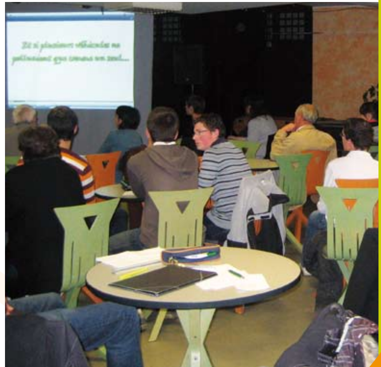
Journée de restitution du concours jeunes 2008-2009, au Pixie